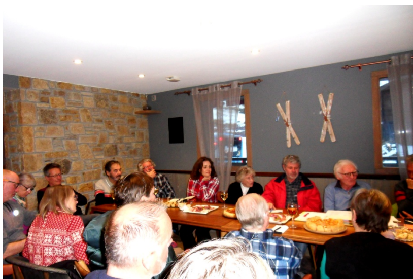
Notre assemblée Générale février 2023