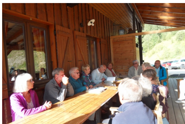
Notre rencontre aout 2023