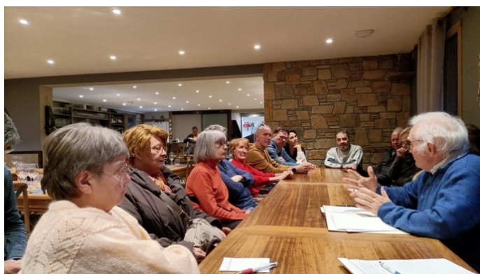
Notre rencontre février 2024