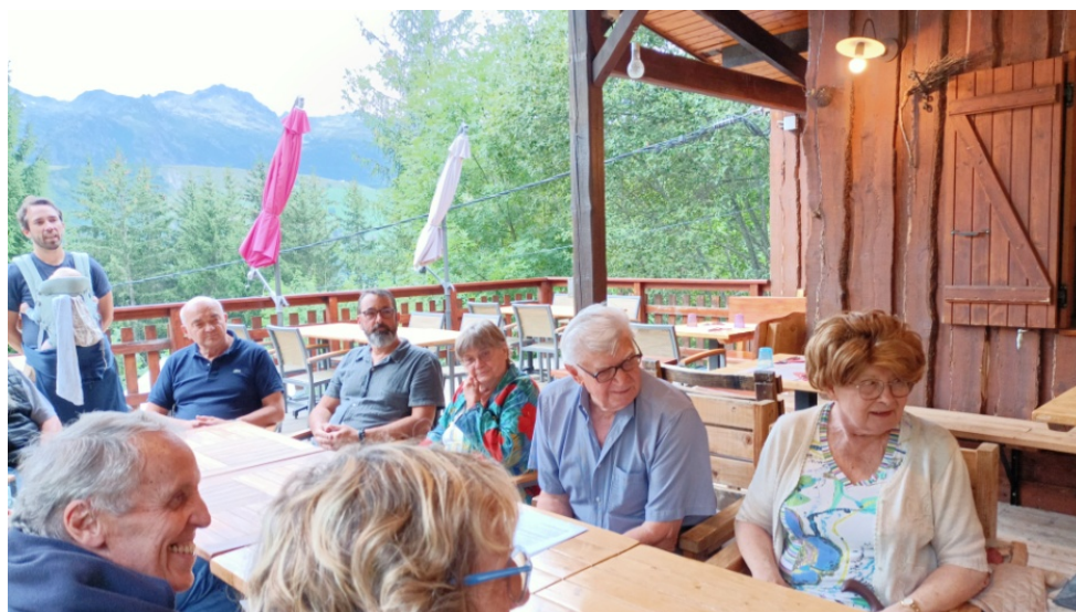
Notre Assemblée Générale été 2024